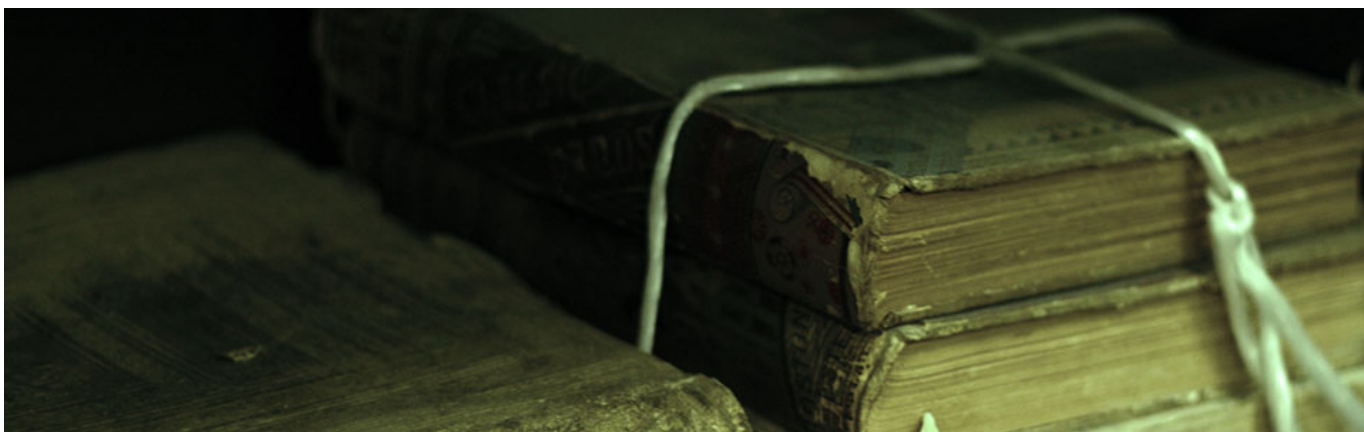
L'agricoltura e gli economisti agrari in Italia dall'Ottocento al Novecento, di Massimo Canali, Giancarlo Di Sandro, Bernardino Farolfi, Massimo Fornasari, ed. Franco Angeli, Milano, 2011